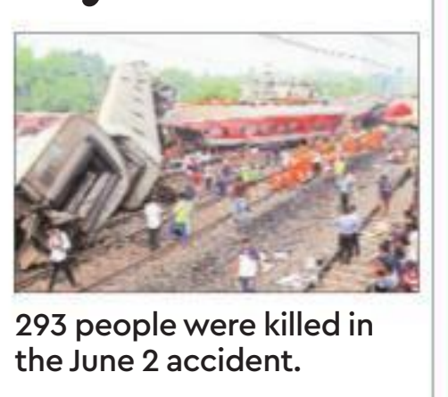
293 people were killed in the June 2 accident.

IN THE FIRST such arrests in recent years, the Central Bureau of Investigation (CBI) on Friday arrested three railway employees in connection with the June 2 train accident involving Coromandel Express and two other trains in Odisha's Balasore district, in which 293 people were killed.